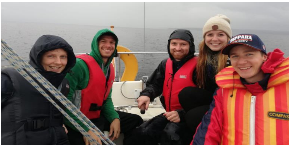
Če nisi jadral in dobil ozeblin ... Nisi bil na Finskem!

naštevam krasne stvari, se ni mogoče ogniti dejstvu, da se v stavbi, imenovani Pinni B, skriva soba, kjer poleg izjemno udobne sedežne garniture najdemo tudi računalnike in konzole za igranje iger, prikladno povezane na zelo moderne televizorje. Na voljo so tudi pisarniški pripomočki in pa vse potrebno za pletenje. Mislim, da ne boste začudeni, ko vam povem, da smo v tem prostoru preživel kar nekaj časa, začuda smo večinoma delali na skupinskih projektih, včasih pa smo se prišli zgolj »odklopit«. V matični stavbi Fakultete za edukacijo in kulturo smo nekega dne po naključju odkrili sobo, ki je namenjena študentskemu druženju. Tam sicer ni bilo igralnih konzol, si pa je utrujen študent lahko pripravil kavo, ki je vsaj zame imela okus po domu.