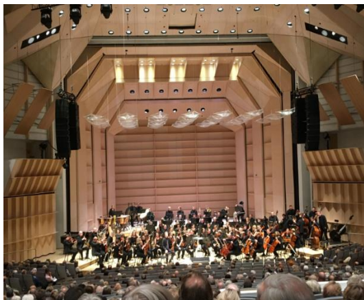
Ogled koncerta v Filharmoniji Tampere študenta stane 5 €.