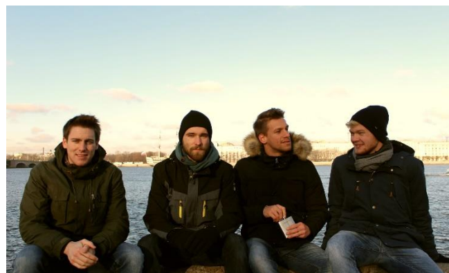
Ambasadorji dobre volje z Nemčije in Slovenije v St. Petersburgu

Tu bi rad omenil, da znajo biti stvari dvoumne. Kar nekajkrat se mi je primerilo, da nisem bil povsem prepričan, kaj točno moram oddati oz. če je stvar oddana pravilno. Nasvet: ne se bat. Če bo kaj res narobe, vas prijazni ter uslužni delavci bojda kontaktirajo in vas prosijo za pojasnitev (po besedah španskih in italijanskih kolegov). Rok oddaje je bil 20. 4. 2019 in 9. 5. 2019, dan po rojstnem dnevu, sem prejel zelo lepo darilo: Letter of acceptance – you have been granted the right to study as an international exchange student at Tampere University (on the city centre and Kauppi campuses).