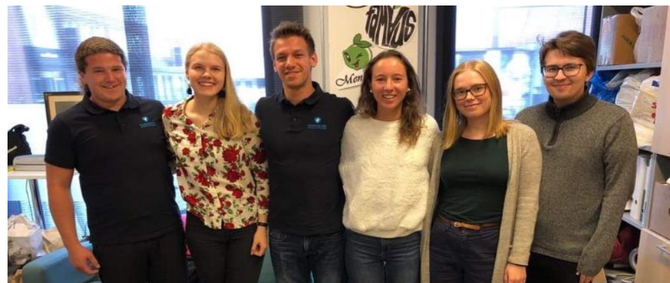
Za sestanek s finskimi študentskimi svetovi se vedno najde čas