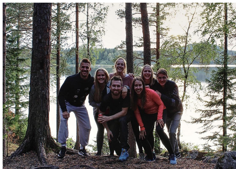
Ambasadorji dobre volje s Češke, Belgije, Nemčije in Slovenije na kampiranju